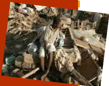
Земетресението в Хаити